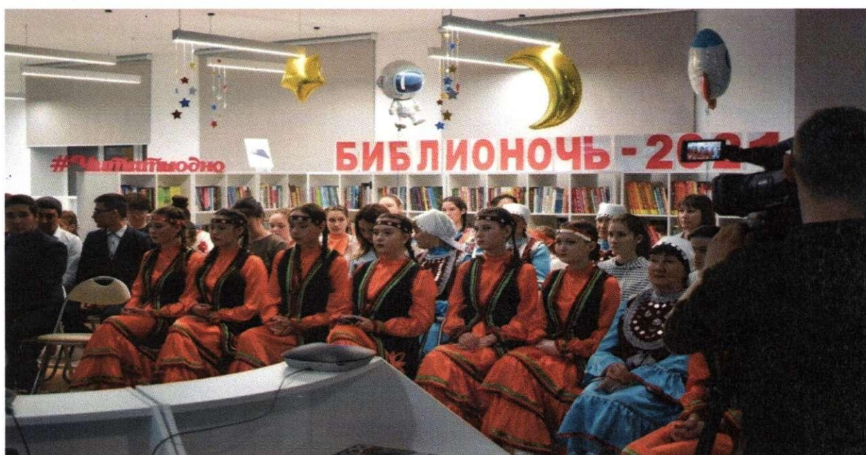
Асяновская сельская модельная библиотека. Библионочь

Асяновская сельская модельная библиотека, признанная одной из лучших организаций культуры Республики Башкортостан, войдя в топ-4 лучших государственных и муниципальных учреждений культуры федерального портала PRO.Культура.РФ, приняла участие в телемосте с космонавтами экипажа Международной космической станции в рамках Всероссийской акции «Библионочь-2021»