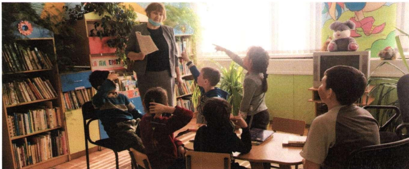
Чишминская СМБ. Литературно-игровая программа "Книга - лучший друг ребят"

Библиотеки межпоселенческой централизованной библиотечной системы полностью оснащены ПК и подключены к сети Интернет. Доля библиотек с созданными автоматизированными рабочими местами составляет 100%. На базе центральной межпоселенческой библиотеки функционирует электронный читальный зал с 3 рабочими местами для пользователей, есть доступ к электронным базам ФГБУ «РГБ» НЭБ, ФГБУ Президентская библиотека имени Б.Н.Ельцина. Работает правовая система «Консультант+». Процент охвата населения района библиотечным обслуживанием составляет 55%. Число пользователей составляет 32 916, число посещений 457 910.