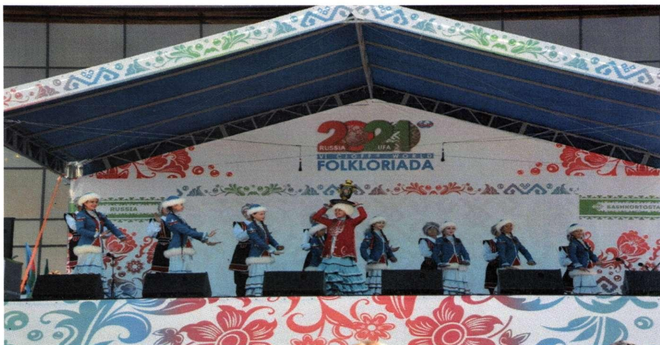
г.Дюртюли. VI Всемирная Фольклориада