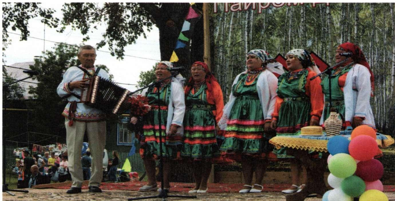
Сельский клуб с. Ивачево. День марийской культуры

В рамках Года здоровья и активного долголетия в Республики Башкортостан были проведены: флешмоб «Энергия здоровья в 55+», акция «Здоровые советы для старшего поколения», культурная прививка "Азбука здорового образа жизни", круглый стол "Формула здоровья", цикл встреч с врачами-специалистами, час полезных советов «Питание и здоровье: как правильно питаться» и др.