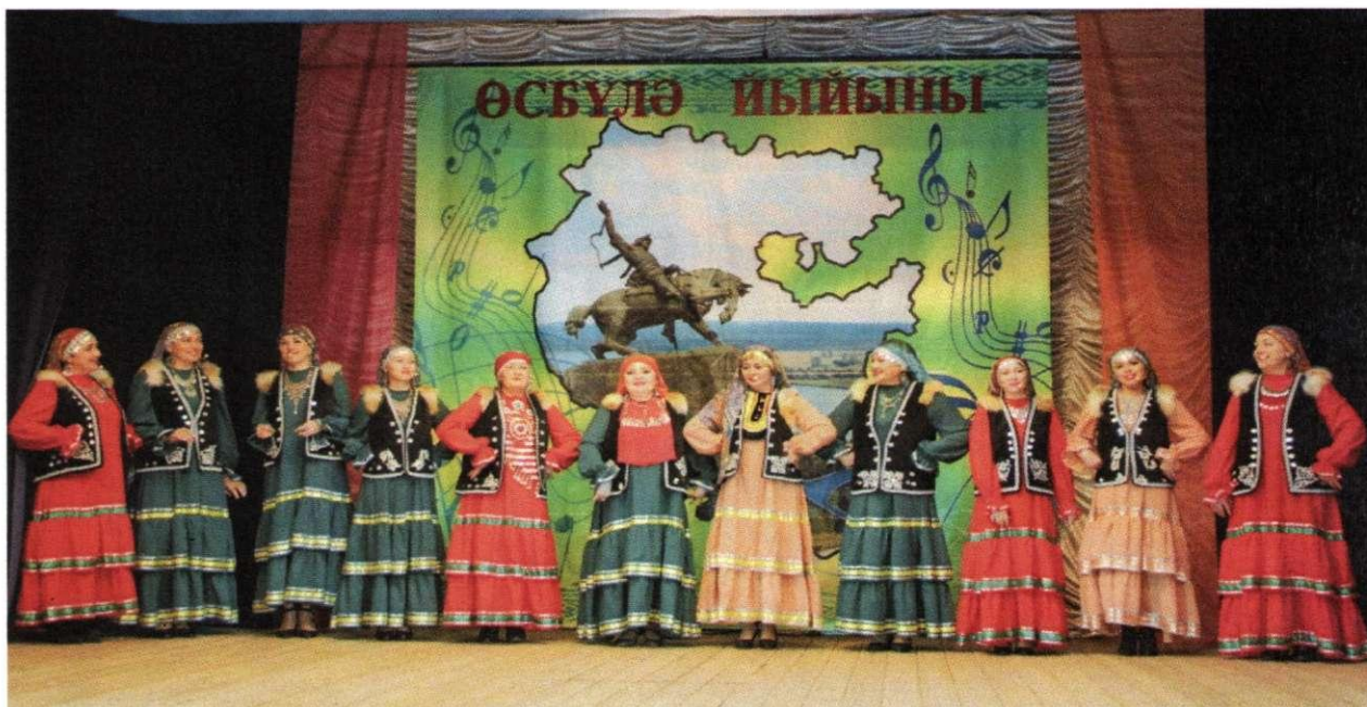
Сельский дом культуры с. Учтили. Народный праздник "Өсбүләйыны" в рамках Года башкирской истории и Дня башкирской культуры

27; театральных – 31; инструментальных – 5; фольклорных – 25; народных промыслов - 16. Участников клубных формирований 1700 человек.