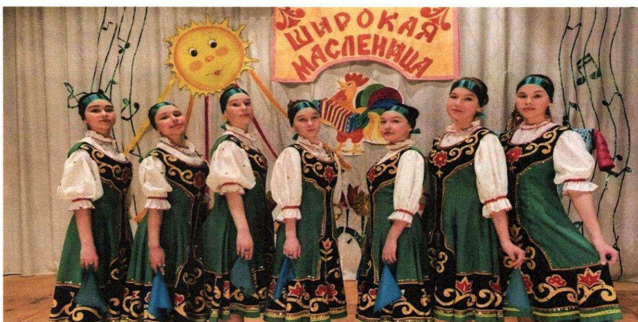
Исмаиловская детская школа искусств. Праздник "Широкая масленица"

В школах искусств района обучаются более 820 детей. Охват детей эстетическим образованием от общего числа детей от 6-18 лет составил 8,5%. В 2021 году 1 учащийся детской музыкальной школы удостоен стипендии Главы Республики Башкортостан. Более 20 выпускников школ искусств, продолжают учебу в ССУЗах и ВУЗах России. Доля детей, принявших участие в конкурсах республиканского, всероссийского и международного уровней от общего количества обучающихся составляет 80%, доля детей, ставших победителями и призерами 61%. На базе школ функционируют 18 творческих коллективов, 4 из которых имеют почетное звание "образцовый" и "народный".