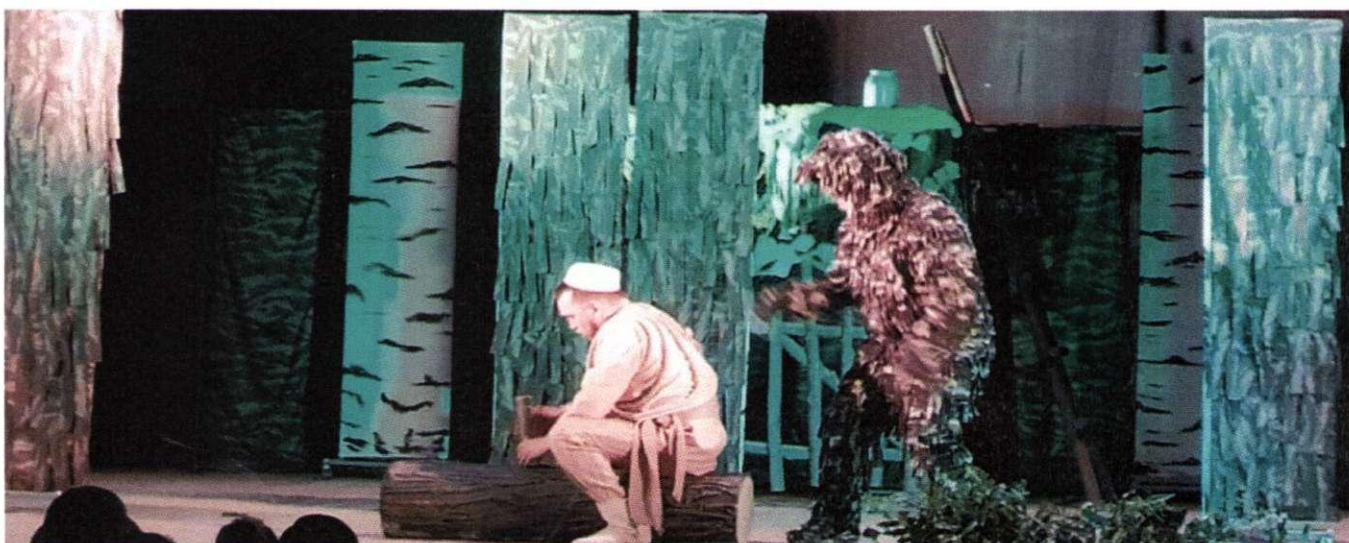
Дюртюлинский татарский театр драмы и комедии. Спектакль для детей "Шурэлелэр ни атлы?"

Коллектив Дюртюлинского татарского театра драмы и комедии за отчетный период вел работу по реализации различных программ, на сцене появились новые спектакли, организованы выездные спектакли, велась общественная деятельность. Театр принимал участие в международных, всероссийских, республиканских, муниципальных мероприятиях и акциях. Продолжена работа по обновлению материально-технической базы театра. По итогам 2021 года число спектаклей – 19, число новых постановок -3, число мероприятий - 19, число посещений - 3805.