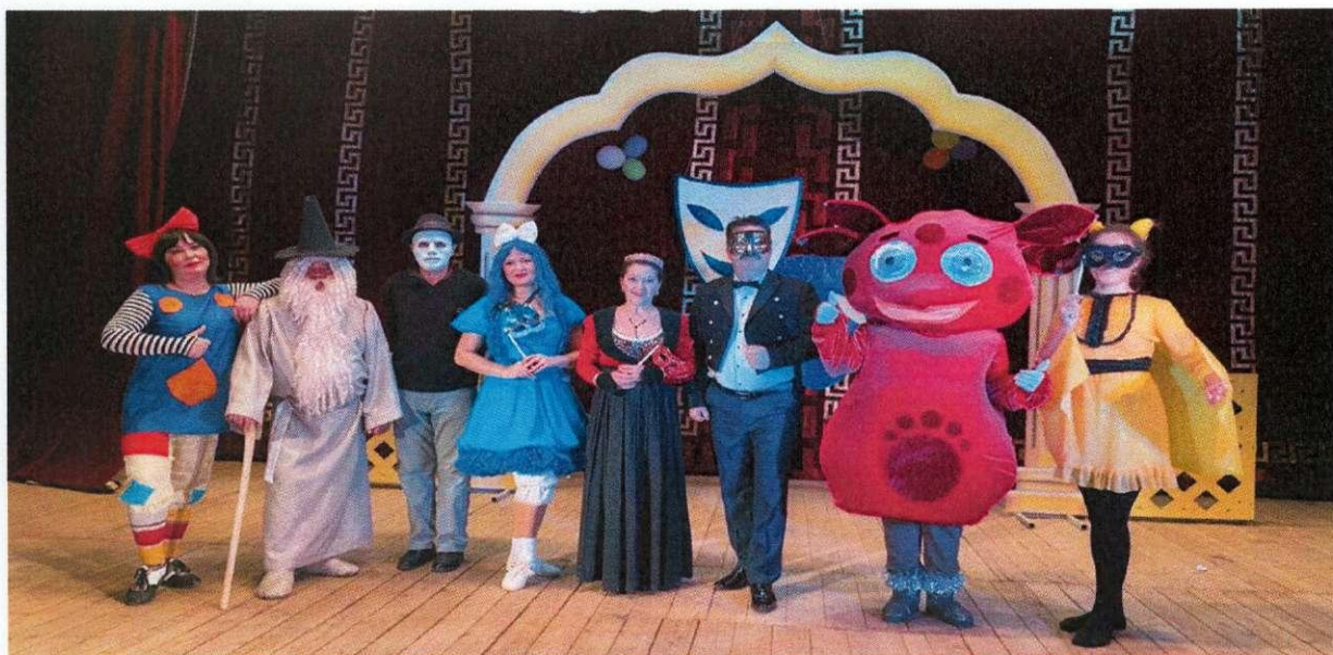
Познавательно-игровая программа «Сердце Театра» (Дюртюлинский ТТДК)