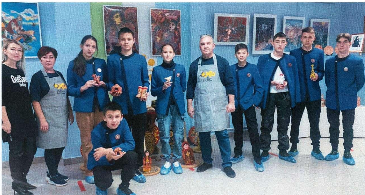
Мастер-класс в гончарной мастерской Дюртюлинской детской художественной школы

Библиотеки межпоселенческой централизованной библиотечной системы полностью оснащены ПК и подключены к сети Интернет. Обеспеченность составляет 100%. Процент охвата населения района библиотечным обслуживанием составляет 55,4% (2022г.-55,4%). Число пользователей составляет 33 040 (2022г. -33 000), число посещений 728 103 ед. (2022г. - 559 496). ЦБС имеет доступ к электронным ресурсам: ФГБУ «РГБ» НЭБ, ФГБУ Президентская библиотека имени Б.Н.Ельцина, базам данных законодательно-правовых документов системы КонсультантПлюс.