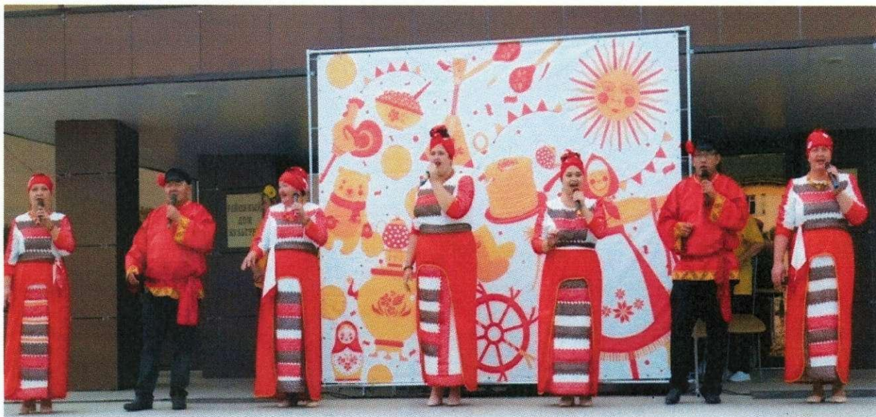
День русской культуры (РДК)

Всего культурно-досуговыми учреждениями в 2023 году проведено 2885 мероприятий. Число посещений составляет – 515 951. Творческий потенциал: функционируют 148 клубных формирования (для детей – 56, для взрослых - 92), 1792 количество участников (детей - 659, взрослых 1133). 16 творческих коллективов имеют звание «народный» и «образцовый».