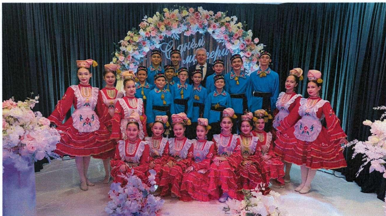
Образцовый хореографический ансамбль «Ак димгель»

XI Открытый Региональный конкурс юных исполнителей на фортепиано среди учащихся детских музыкальных школ и детских школ искусств «ЮНЫЙ ВИРТУОЗ - 2023». Конкурс прошел при поддержке Филиала Российского Фонда культуры - Республиканской благотворительной программы «Новые имена» в онлайн-формате. В конкурсе приняли участие 160 пианистов школ искусств разных городов нашей страны и Республики Башкортостан. Жюри определило лучших исполнителей в пяти возрастных номинациях. 42 юных конкурсантов стали лауреатами I степени.