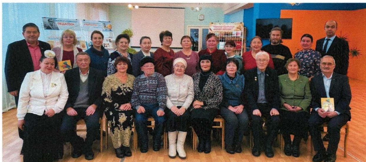
Акция «С книгой по жизни» (ЦМБ)

Библиотеки межпоселенческой централизованной библиотечной системы полностью оснащены ПК и подключены к сети Интернет. Обеспеченность составляет 100%. Процент охвата населения района библиотечным обслуживанием составляет 55,4% (2022г.-55,4%). Число пользователей составляет 33 040 (2022г. -33 000), число посещений 728 103 ед. (2022г. - 559 496). ЦБС имеет доступ к электронным ресурсам: ФГБУ «РГБ» НЭБ, ФГБУ Президентская библиотека имени Б.Н.Ельцина, базам данных законодательно-правовых документов системы КонсультантПлюс.